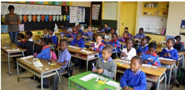
Unterricht an der Swakopmund Primary School

Der Verein Sonnenkinderprojekt e.V. hat es sich zur Aufgabe gemacht, möglichst vielen benachteiligten Kinder in Namibia den Schulbesuch nicht nur der Grundschule, sondern auch der weiterführenden High School zu ermöglichen. Hierfür vergibt er Schulpatenschaften , in deren Rahmen die deutschen Paten monatlich einen festen Betrag bezahlen, von dem das Schulgeld sowie ein kleiner Beitrag zum Lebensunterhalt abgedeckt werden.