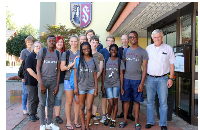
Besuch der namibischen Klimascouts 2016 in Sulingen

Ebenfalls aktiv ist das Sonnenkinderprojekt in der Ausbildung, Begleitung und Zusammenführung so genannter Klimascouts an den namibischen wie auch deren deutschen Partnerschulen. Klimascouts sind jugendliche Botschafter für Klima- und Umweltthemen, die ein internationales Netzwerk aufbauen. So werden elementare Anliegen wie Umweltschutz und Völkerverständigung zu einem spannenden Projekt für Jugendliche verbunden.